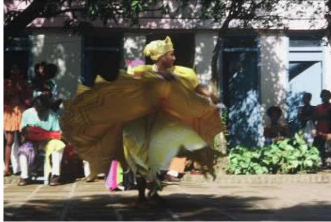
La danza di Ochún