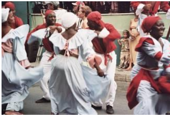
Piccolo spettatore