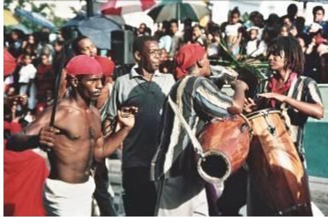
Suoni e danze