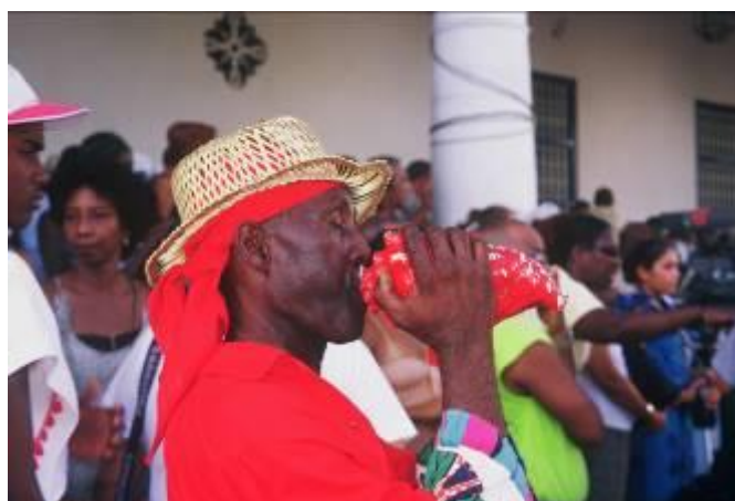
Inizia la Fiesta