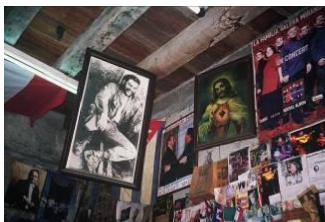
Cristo Che, la Escalera