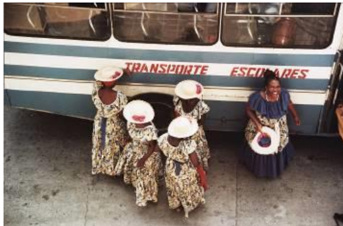
Un volto tra i capelli