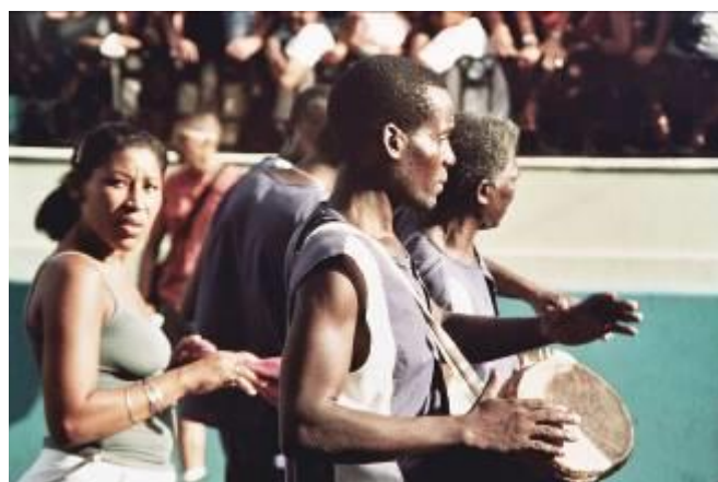
Sotto il sole della Fiesta del Fuego