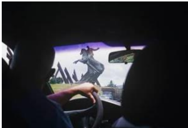
Plaza de la Revolucion