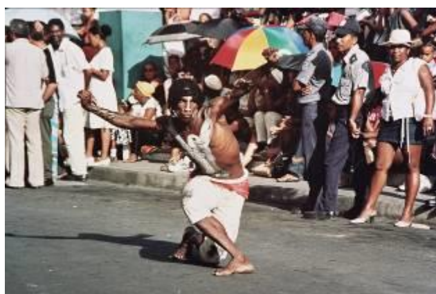
Uomo aquila